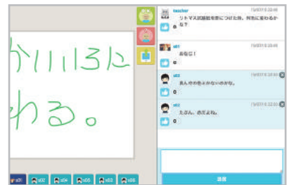
コメント、いいね機能

生徒が自分のノートだけでなく、他生徒のノートの閲覧・編集を許可することができます。これにより、ある生徒のノートにみんなで書きあって、グループの調べ物活動やまとめなどを作成、発表することができます。