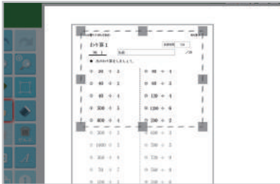
PDF/ 写真の取り込み・編集

先生お手製のプリントやタブレットのカメラで紙の教材を撮影し、取り込むことができます。取り込んだデータは切り取りや拡大縮小、回転など編集することも可能です。