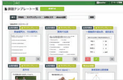
教材テンプレート

先生お手製のプリントやタブレットのカメラで紙の教材を撮影し、取り込むことができます。取り込んだデータは切り取りや拡大縮小、回転など編集することも可能です。