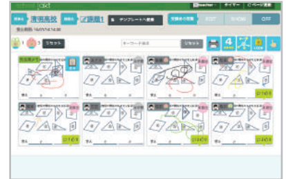
リアルタイム解答一覧

3000 以上のプリセットされた教材を利用したり、お手製のドリルやプリントをテンプレートとして他の先生に配布できます。また授業のログも共有することができるため、その教材で躓きやすいポイントを把握することができます。